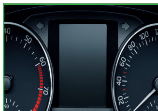
Komputer pokładowy z wyświetlaczem MAXI DOT