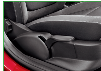
Fotel pasażera z regulacją wysokości