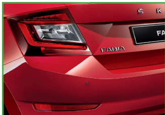
Czujniki parkowania z tyłu