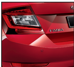
Czujniki parkowania z tyłu