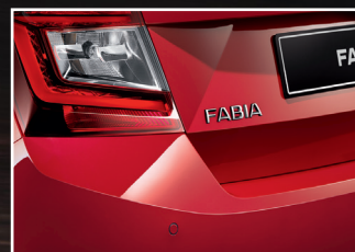
Czujniki parkowania z tyłu