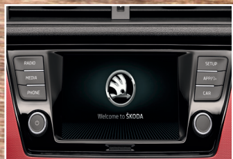
Radio SWING PLUS Bluetooth, SmartLink