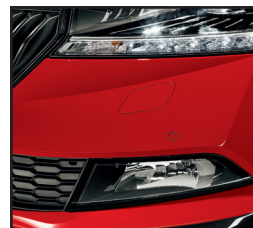
Światła przeciwmgielne z przodu