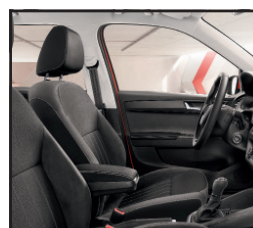
Pakiet zimowy podgrzewane fotele przednie i spryskiwacze szyby przedniej