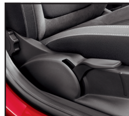
Fotel pasażera z regulacją wysokości