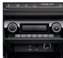
CLIMATRONIC klimatyzacja automatyczna z automatycznie przeciemiającym lustrem wstecznym