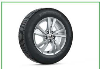
Obcęże kół ze stopów lekkich CYGNUS 15"