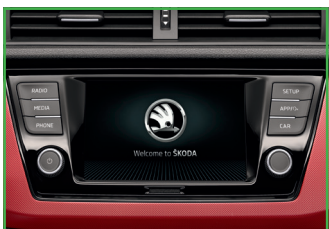
Radio SWING PLUS (SmartLink, ŠKODA Surround, 2 dodatkowe głośniki z tyłu)