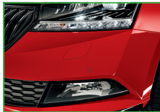
Światła przeciwmgielne z przodu