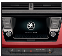
Radio SWING PLUS (SmartLink, ŠKODA Surround, 2 dodatkowe głośniki z tyłu)