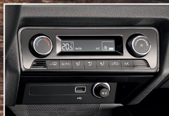
Klimatyzacja automatyczna Climatronic