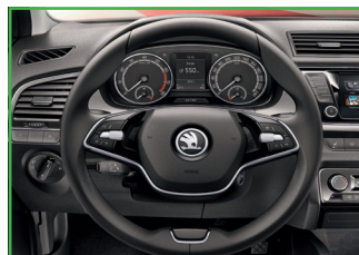
Dwuramienna skórzana kierownica wielofunkcyjna (radio + telefon)