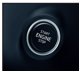
KESY bezkluczkowy dostęp do samochodu i uruchamianie silnika