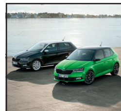
Color Concept dach, słupki A oraz obudowy lusterek bocznych w wybranym kolorze

Pakiet promocyjny SILVER o wartości 6 700 zł