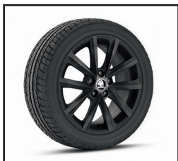
Obcęże kół ze stopów lekkich VIGO 7J x 16" w wybranym kolorze