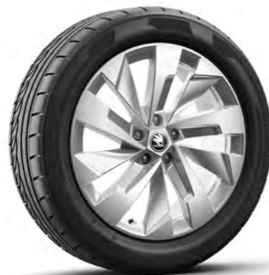
Obręcze kół ze stopów lekkich 19" Aero Rapeto, srebrne