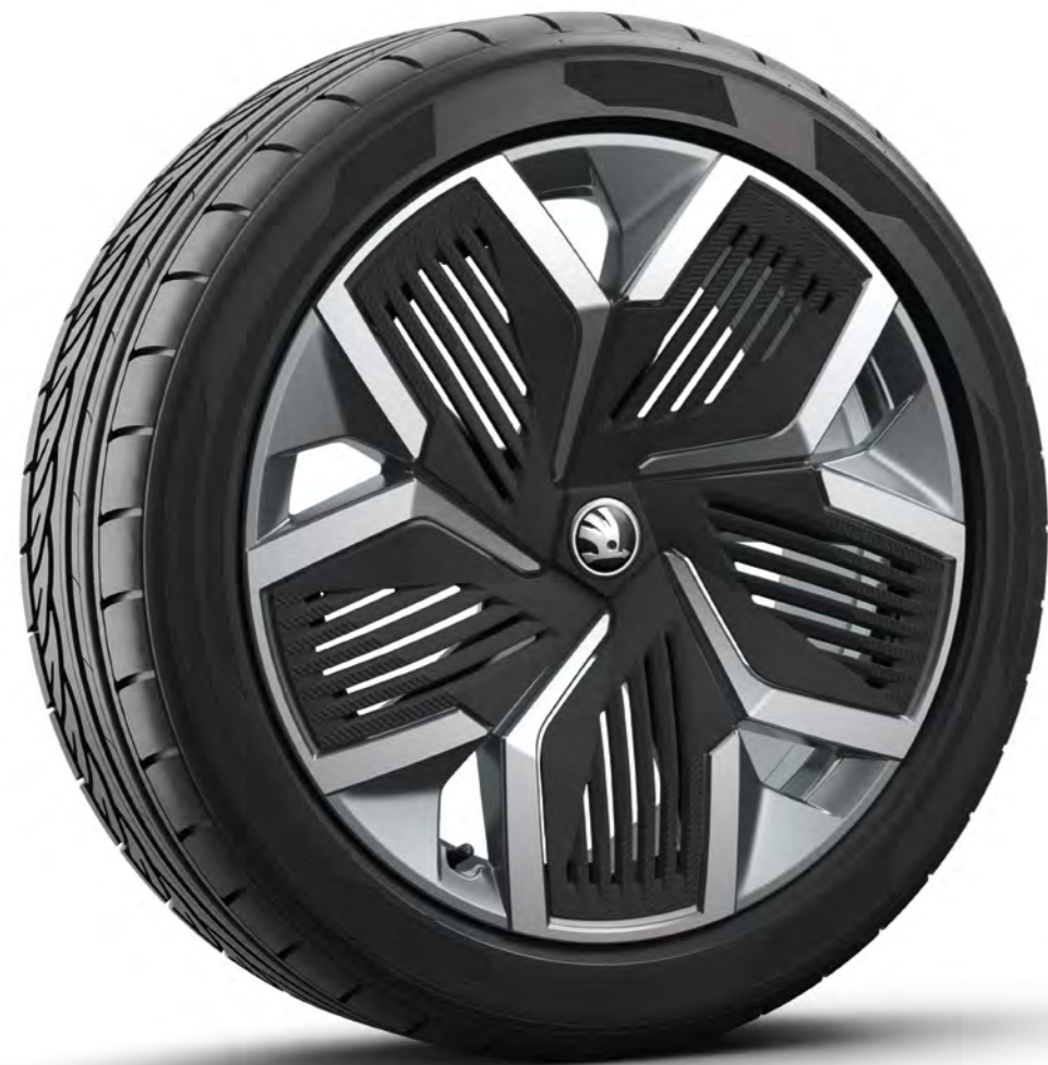
Obręcze kół ze stopów lekkich 20" Aero Rila, antracytowe, z czarnymi nakładkami Aero