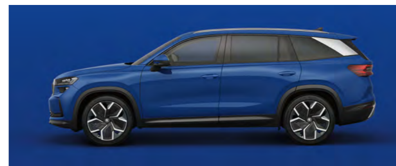
Błękit Energy, niemetalizowany