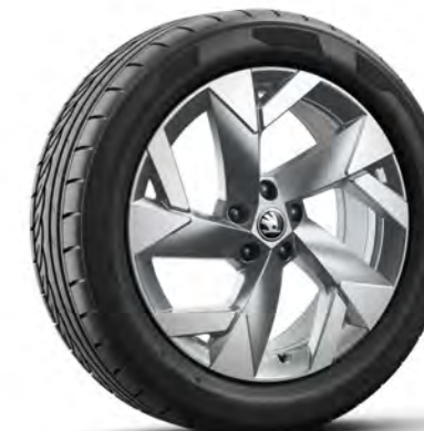
Obręcze kół ze stopów lekkich 19" Aero Tirsuli, antracytowe*