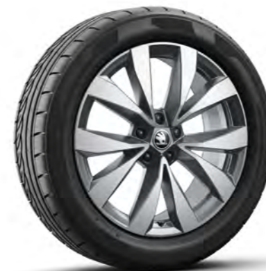
Obręcze kół ze stopów lekkich 19" Aero Lefka, antracytowe