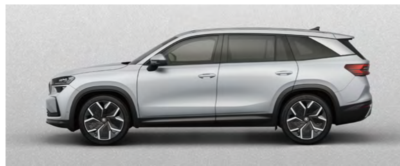
Srebrny Brilliant, metalizowany