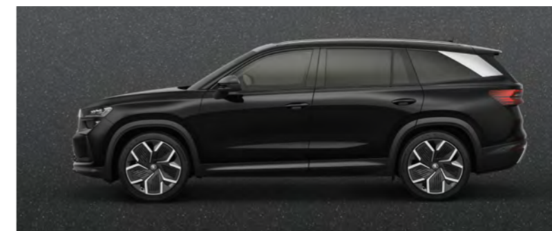
Czerń Magic, metalizowany