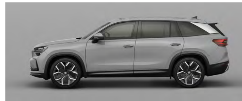
Szary Steel, niemetalizowany