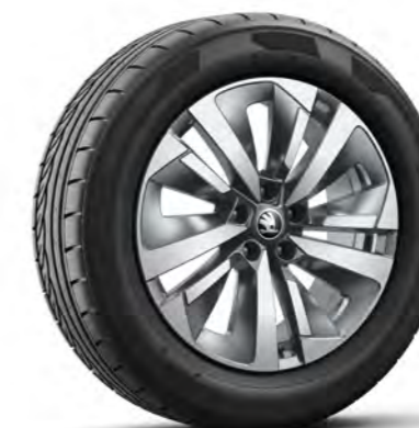
Obręcze kół ze stopów lekkich 18" Aero Soira, antracytowe