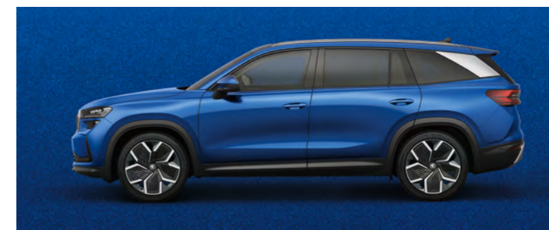
Błękit Race, metalizowany