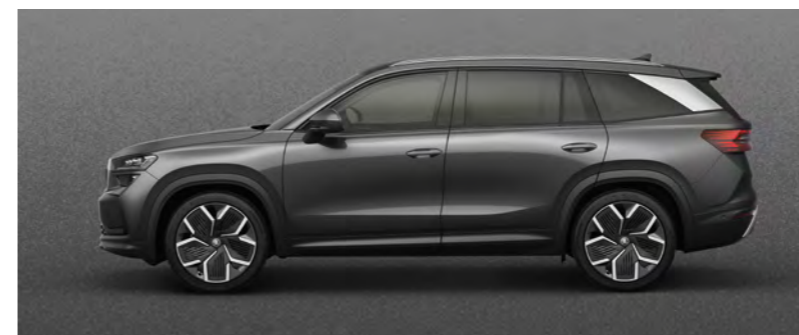
Szary Graphite, metalizowany