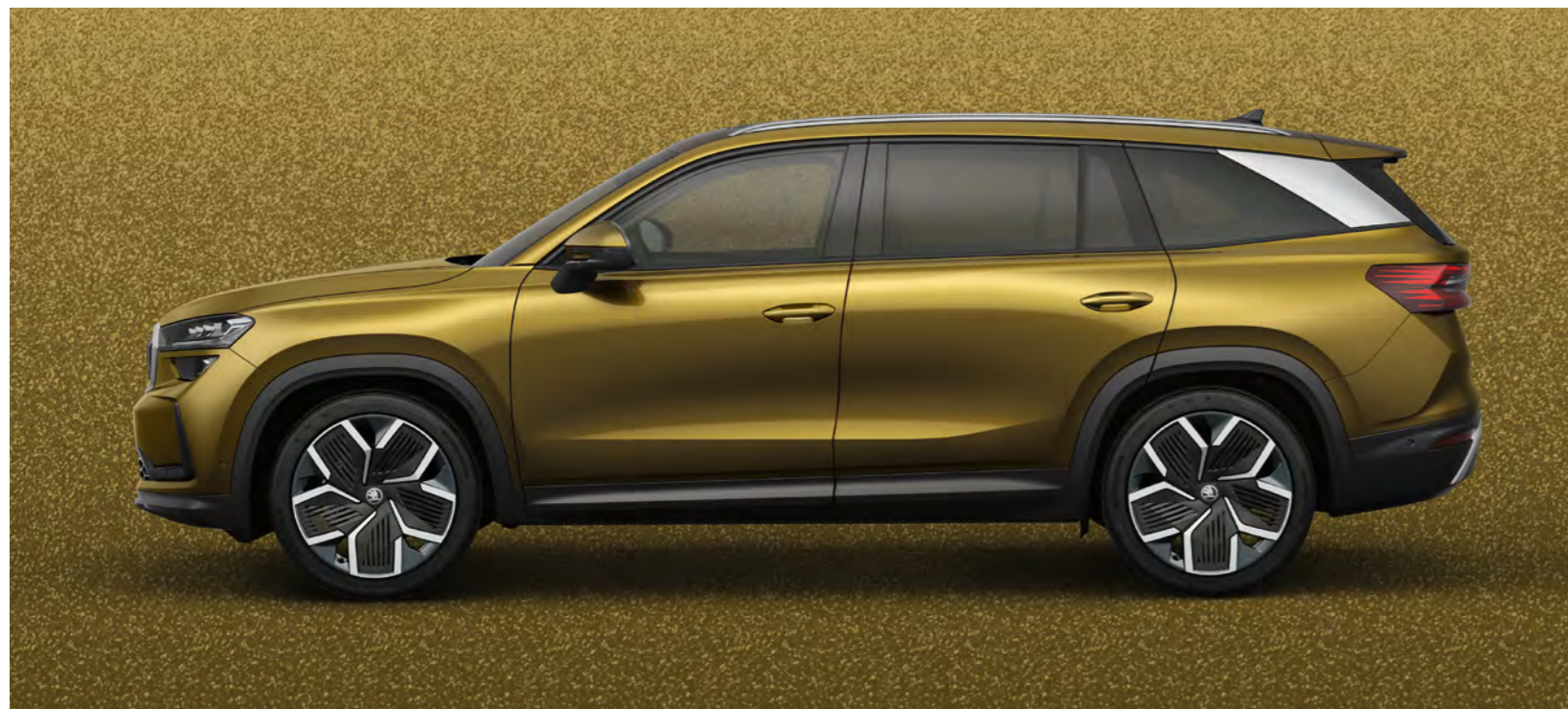
Złoty Bronx, metalizowany