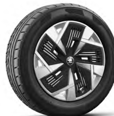
Obręcze kół ze stopów lekkich 18" Aero Mazeno, srebrne, z czarnymi z nakładkami Aero