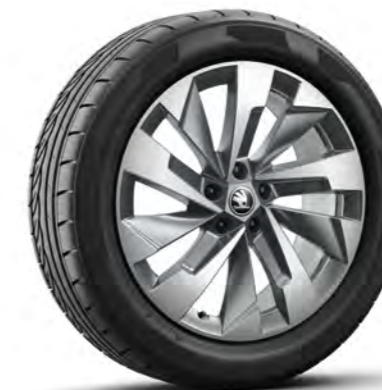
Obręcze kół ze stopów lekkich 19" Aero Halti, antracytowe