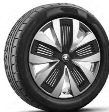
Obręcze kół ze stopów lekkich 19" Aero Talgar, srebrne, z czarnymi nakładkami Aero