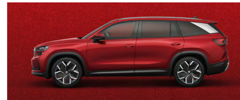
Czerwień Velvet, metalizowany