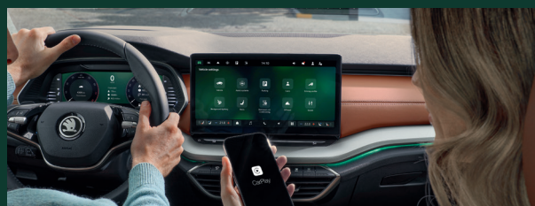
Funkcja Smartlink z połączeniem bezprzewodowym*