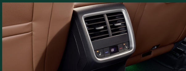
Climatronic automatyczna 3-strefowa klimatyzacja z regulacją elektroniczną