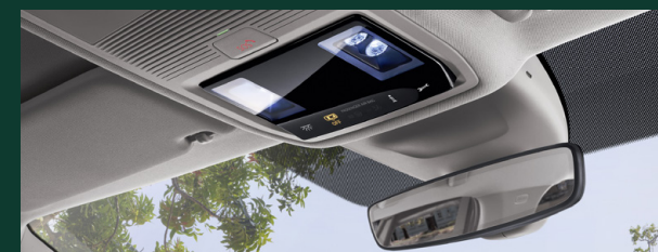
Port USB-C - umieszczony w lusterku wewnętrznym samochodu