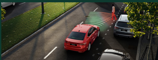
Front Assist – kontrola odstępu z funkcją awaryjnego hamowania