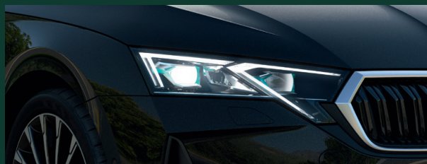
Oświetlenie LED - reflektory TOP LED Matrix