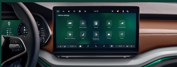
Wyświetlacz Infotainment 13" z nawigacją