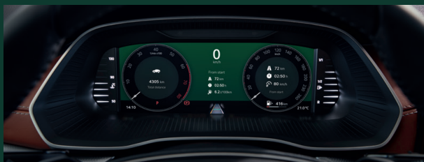
Virtual Cockpit - cyfrowy zestaw wskaźników