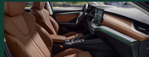
Komfort podróży - ergonomiczne siedzenia z certyfikatem AGR