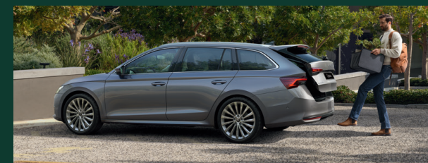
Bezdotykowe otwieranie i zamykanie elektrycznie sterowanej pokrywy bagażnika