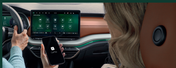
Funkcja Smartlink z połączeniem bezprzewodowym*