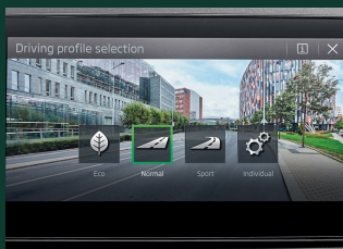
DRIVING MODE SELECT - wybór profilu jazdy (nieдоступny dla 1.0 MPI)