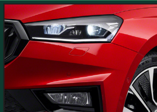
Reflektory przednie Bi-LED z funkcją adaptacji świateł AFS oraz funkcją CORNER