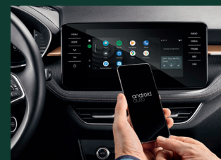
SmartLink z możliwością połączenia bezprzewodowego