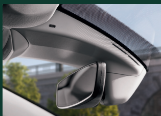
Dwa gniazda USB-C z tyłu i dodatkowe gniazdo USB-C w podsufitce