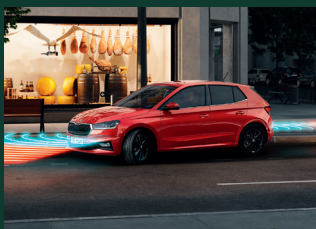
Czujniki parkowania z przodu i z tyłu z MANOEUVRE ASSIST