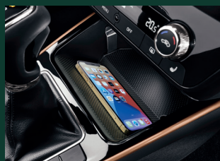
Bluetooth Plus PHONE BOX - wzmacnianie sygnału GSM, indukcyjna ładowarka do smartfona