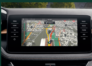
Nawigacja AMUNDSEN ekran 9,2", funkcja rozpoznawania znaków drogowych