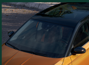
Elektrycznie ogrzewana przednia szyba