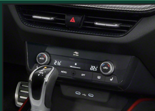
CLIMATRONIC - dwustrefowa klimatyzacja automatyczna