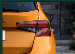
Tylne światła w technologii LED