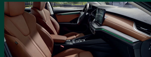
Komfort podróży - ergonomiczne siedzenia z certyfikatem AGR