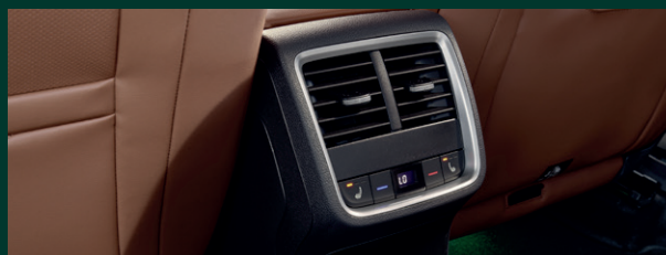
Climatronic automatyczna 3-strefowa klimatyzacja z regulacją elektroniczną