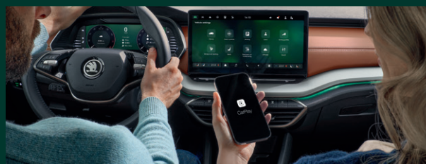
Funkcja Smartlink z połączeniem bezprzewodowym*